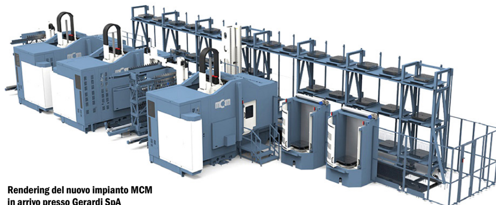
Rendering del nuovo impianto MCM in arrivo presso Gerardi SpA